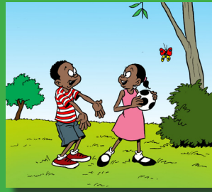
Nyuma yo kwiga inyuguti ya p/P

Udukuru dukubiye muri aka agatabo turimo amagambo agizwe gusa n'inyuguti abanyeshuri bamaze kwiga. Abanyeshuri bashobora kwisomera utu dukuru bo ubwabo nyuma yo kwiga inyuguti zigaragara hejuru. Kubera ko hari igitabo gisanzwe cy'umunyeshuri, aka gatabo gakubiyemo ubwoko bw'udukuru tw'inyongera umunyeshuri azajya asoma ku giti ke kugira ngo akomeze akore indi myitozo yo kwimenyereza gusoma inyuguti yize. Umubyeyi cyangwa undi muntu mukuru ubana n'umunyeshuri asabwe kujya afasha umunyeshuri gusoma agakuru no kumubaza ibibazo bijyanye na ko byateganijwe.