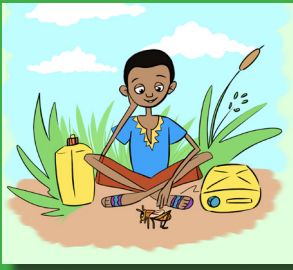
Nyuma yo kwiga inyuguti ya j/J